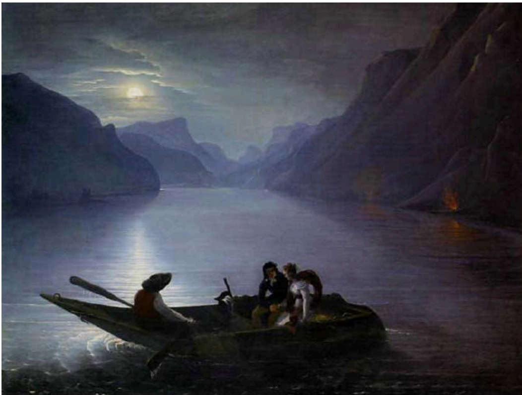
(1824, Le lac de Genève, Promenade de Julie et Saint Preux par Charles Edouard Le Prince illustrant le roman Julie ou la nouvelle Héloïse de Jean-Jacques Rousseau paru en 1761)

Les traces picturales sont rares. Les premiers journaux avec des illustrations assez nombreuses commencent à paraître vers 1830 (La Caricature, Le Charivari, Le Journal Illustré, Le Magasin Pittoresque...). Parmi les tableaux de peintres, l'image classique ou religieuse domine. Les représentations de paysages ou de scènes figuratives sont rares. Sur la période concernée, se succèdent le style rococo (1730-1760), le néo-classicisme (1770-1810) et le romantisme (1800-1870).