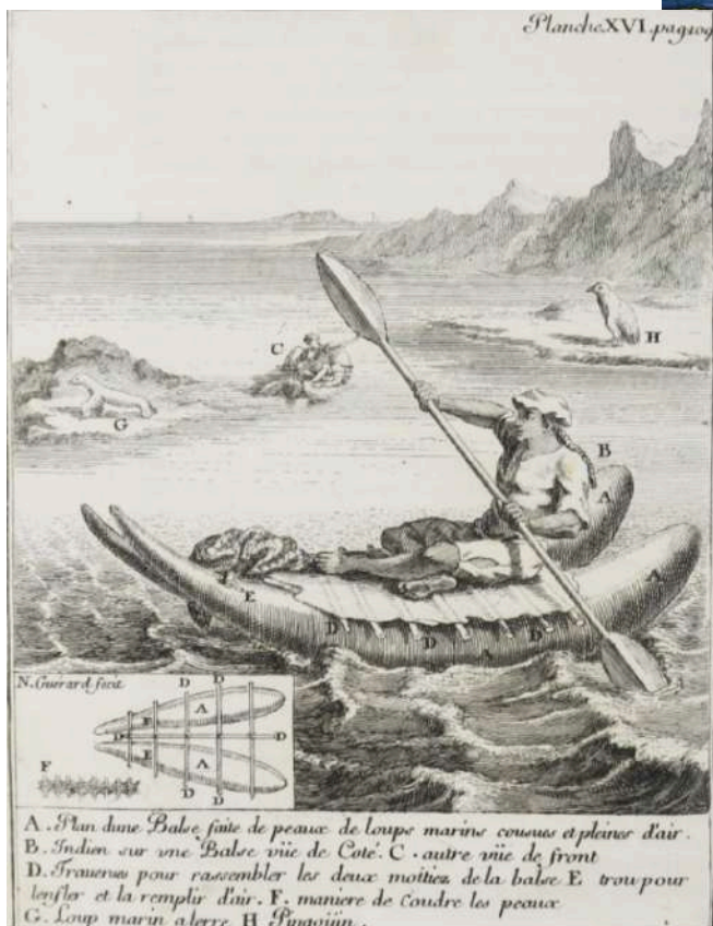
1716 Image d'un balse, bateau sud-américain. Relation de voyage au Chili et au Pérou par Frezier Amedee-Francois. Les secrets des peuples étrangers sont dévoilés au regard de tous. ( vente Drouot )

Les livres relatifs aux événements et aux idées qui marquent la fin du XVIIIème offrent une autre source documentaire par les gravures qui sont parfois proposées.