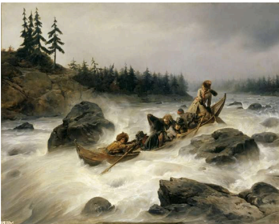
Le Duc d'Orléans descend le grand rapide de l'Eijampaïka sur le fleuve Mionio, en Laponie, août 1795. Biard François (1798 - 1882)

Comme plus tard Mac Gregor à bord de son canoë Rob-roy (1867), Stevenson dans la descente de l'Oise (1878), ou la première descente de la Seine de Paris à Rouen citée dans le Canotage en France (1832), un jeune anglais, John Evelyn descend la Loire en trois jours, de Roanne à Orléans, en maniant lui-même l'aviron en 1664 (Bonnard L. p2 Bulletin mensuel du Canoë Club de France, 1928). Ce récit de voyage préfigure l'extension du tourisme nautique. Les déplacements des personnalités d'une résidence à une autre sont l'occasion d'emprunter la voie d'eau et de pratiquer toutes les formes de propulsion utilisées par le canotage. Ils sont des éléments de propagande utiles mettant en avant le courage et l'esprit de progrès de ceux qui les pratiquent.