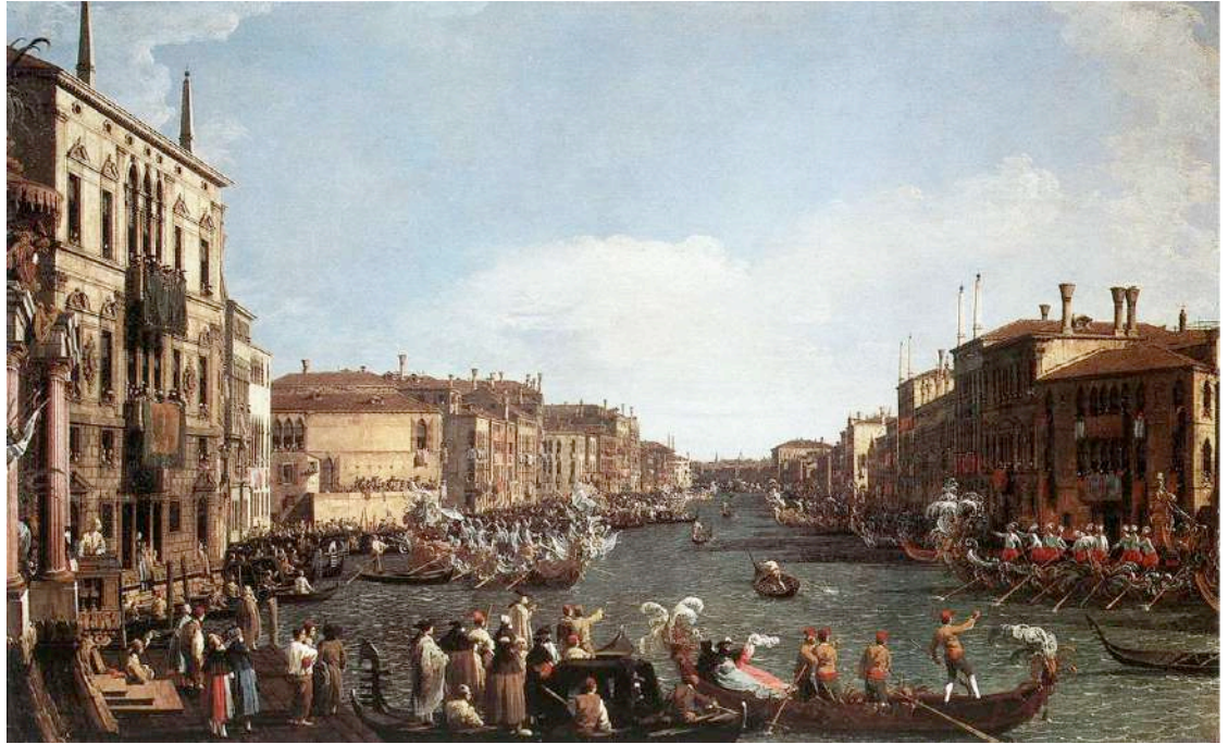
Canaletto Antonio. A regatta on the Grand Canal (1732) National Gallery Londres