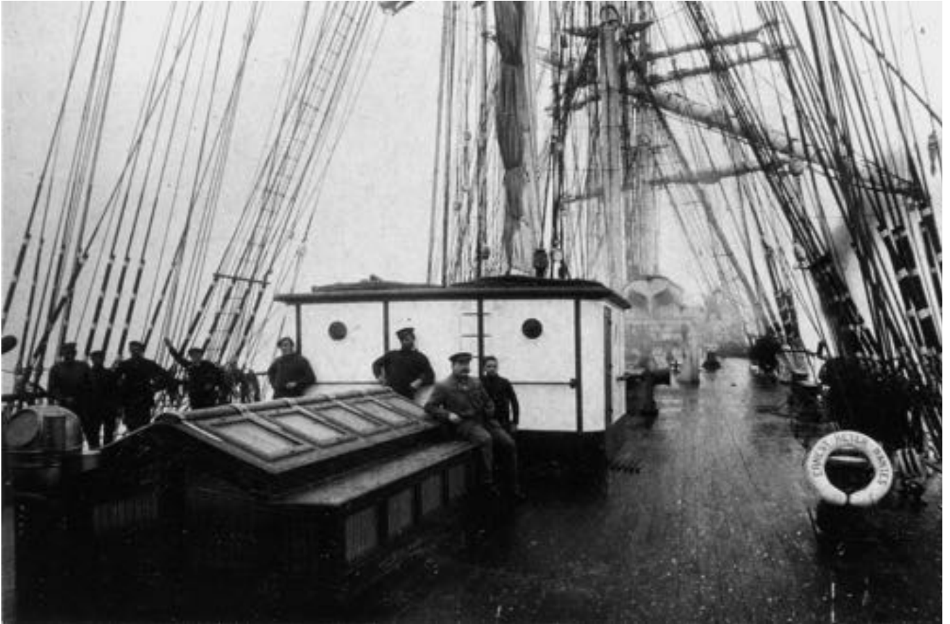
À bord d' Ernest Reyer vers 1910.