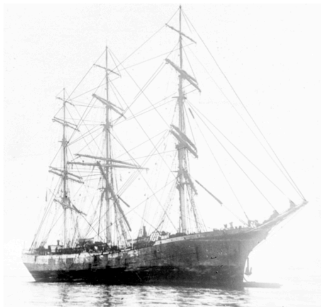
Trois-mâts carré Ernest Reyer de l'armement Norbert et Claude Guillon (Nantes).